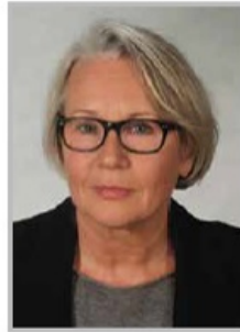
Projektkoordination Dorothea Garotti